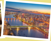
朱鷺メッセから望む 新潟島の夜景