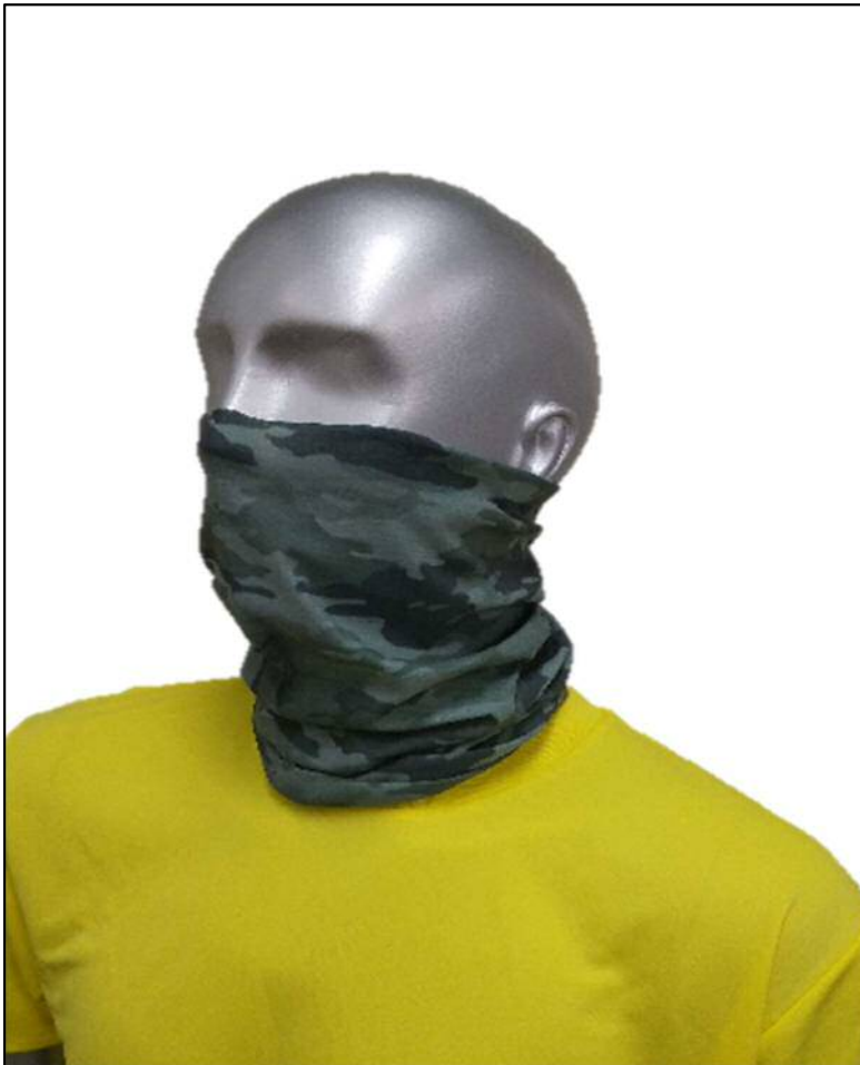
(参考) マネキン着用画像